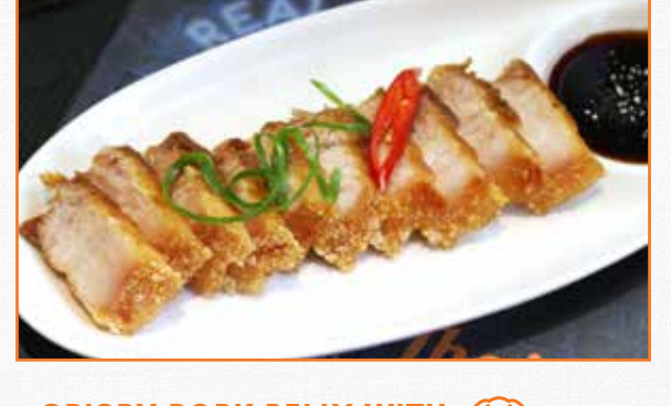
CRISPY PORK BELLY WITH 🍪 SWEET BLACK SOY SAUCE หมูกรอบ ซี่ อิ๊วดำหวาน