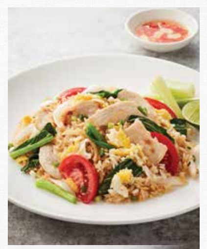
FRIED RICE With Egg, Chinese Brocolli, Onion and Tomato ข้าวผัด