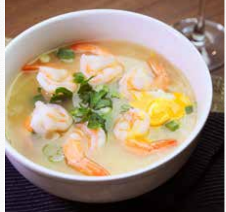
KHAO TOM 🔨 🥎 Thai Porridge ข้าวต้ม