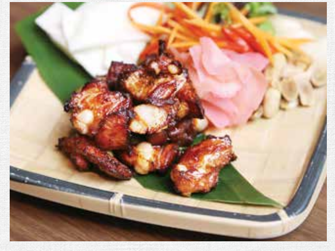
DEEP FRIED FERMENTED PORK RIBS (10 PCS)