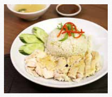
THAI - HAINANESE 🧥 CHICKEN RICE Served with hot soup and

ไก่ทอดภูเก็ต **extra a piece of Phuket 12.9 Fried Chicken