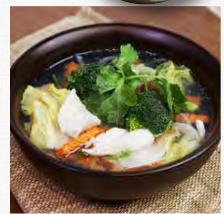
CLEAR CHICKEN SOUP with mixed vegetable