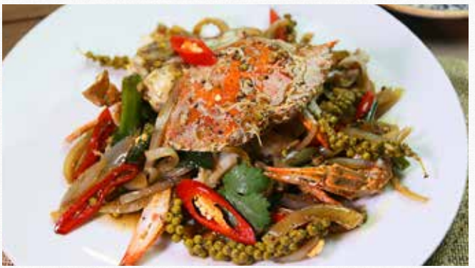
BLUE SWIMMER CRAB WITH SALT AND BLACK PEPPER