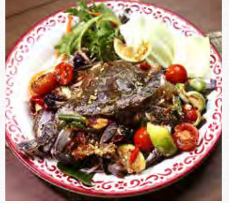
TUM POO MA Raw Blue Swimmer Crabs salad with chilli lime dressing with Thai fermented fish