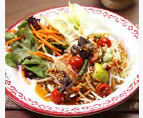
SOM TUM THAI POO Papaya Salad with Dried Shrimp and Sweet Fermented Crab