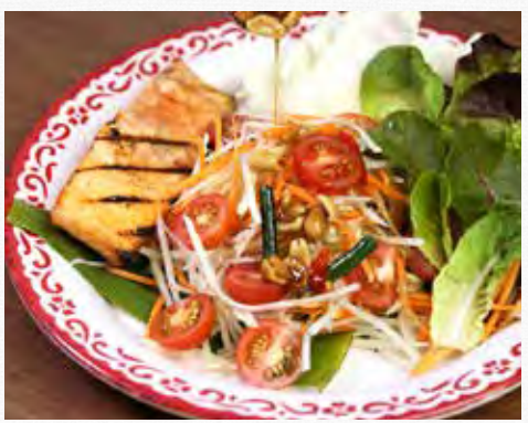
GRILLED SALMON 😂 WITH PAPAYA SALAD