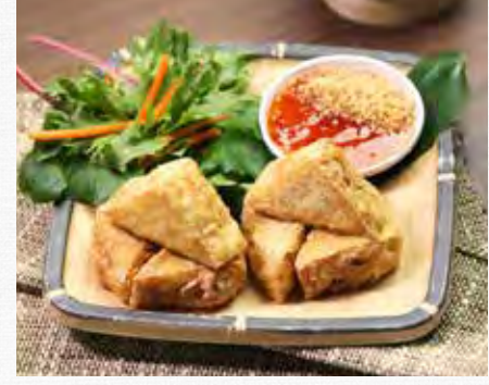
FRIED TUFU Served with peanut sauce 13.9 เต้าหู้ทอด