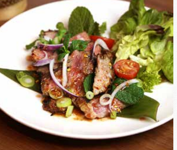
NHAM TOK 🍪 😽 📞 (Choice Of Grilled Pork Or Beef) With Red Onion, Ground Chilli, Lime Juice, 32.9 Ground Rice and Thai Herbs