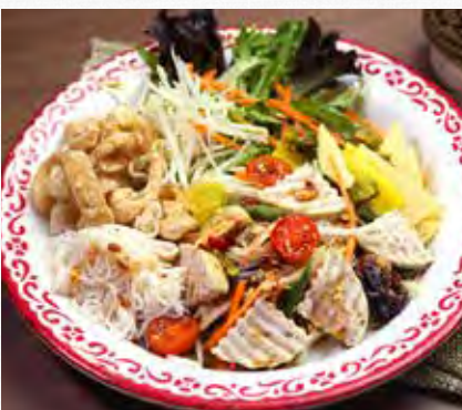
SOM TUM MUA TO Papaya Salad with vegetables, anchovy, pork cracker, pork slice, and raw pickled crabs