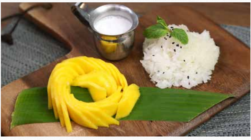
MANGO STICKY RICE