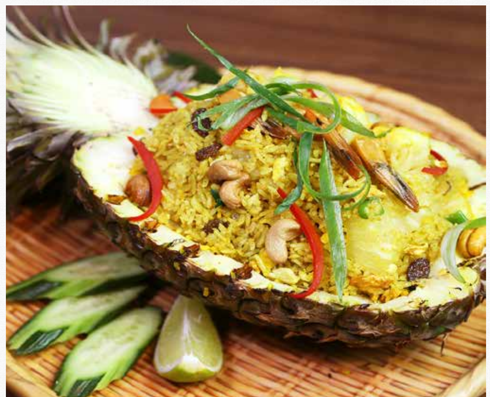
PINEAPPLE FRIED RICE (พith Pineapple, Raisin, Chicken, Prawns Cashew Nut and Curry Powder ข้าวผัดสัปปะรถ

ALL OUR DISHES MAY CONTAIN TRACES OF ALLEGENS