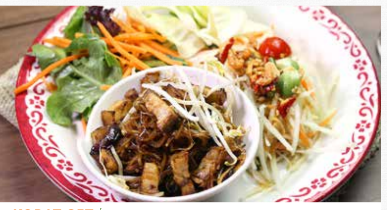
KORAT SET With Som tum and Pad Mee Korat (Stir fried noodle) ผัดหมี่โคราช + ส้มตำโคราช 28.9