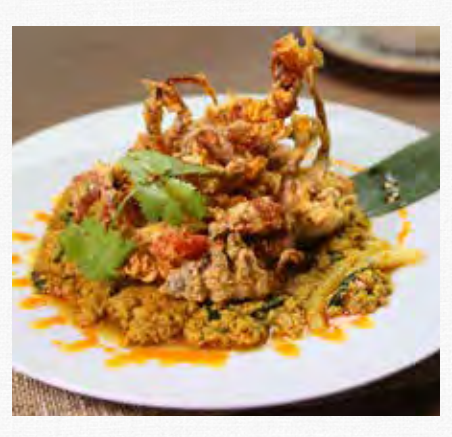
STIR FRIED SOFT SHELL CRAB