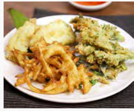
DEEP FRIED MIXED VEGETABLE & Served with plum sauce 15.9 ผักชุปแป้งท่อด