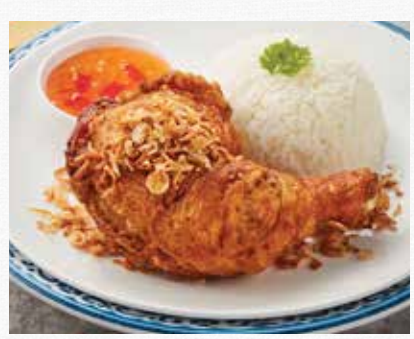
PHUKET 🔨 FRIED CHICKEN WITH RICE