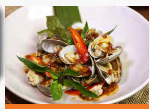
STIR FRIED BABY CLAM WITH CHILLI JAM หอยลายผัดพริกเผา 30.9