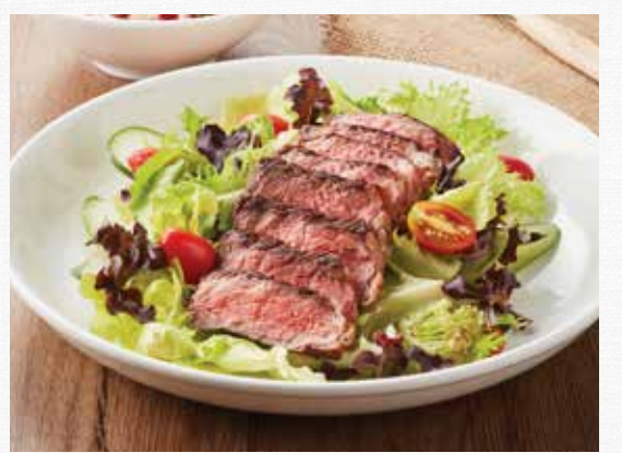
THAI BEEF SALAD (Sirloin 250g)