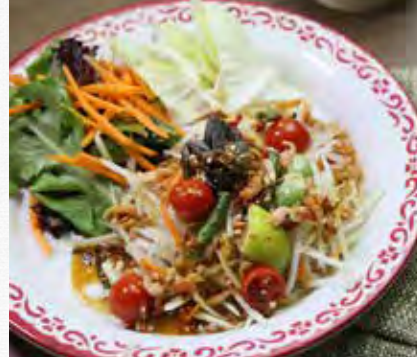
SOM TUM KORAT Papaya salad with dried & fresh chilli, thai fermented fish, peanut, dried shrimp and fermented crab