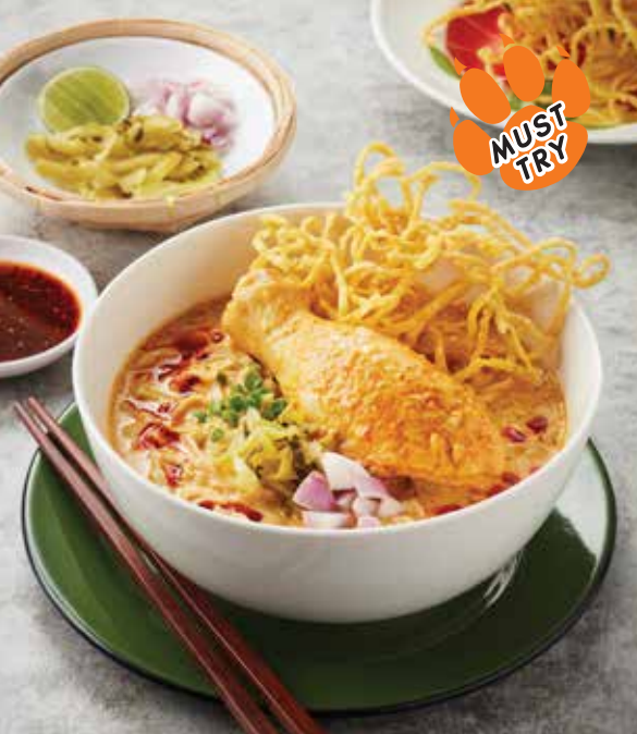
KHAO SOI (Chicken Drumstick)

Northern Thai Style Curry with Egg Noodle