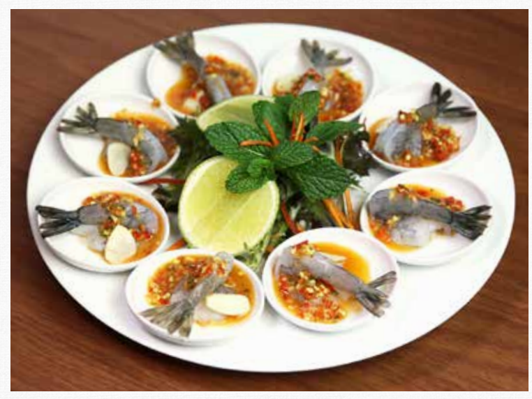
RAW SHRIMP WITH SPICY & SOUR SAUCE

Raw Prawns salad in Thai fish sauce served with chilli lime dressing