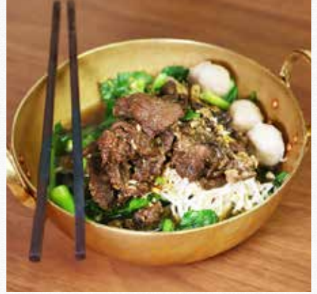
BRAISED BEEF SOUP Served with Beansprout and Chinese broccoli