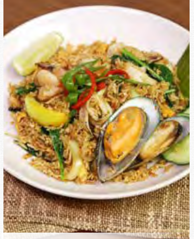
TOM YUM FRIED RICE With Spicy and Sour Paste ข้าวผัดตัมยำ