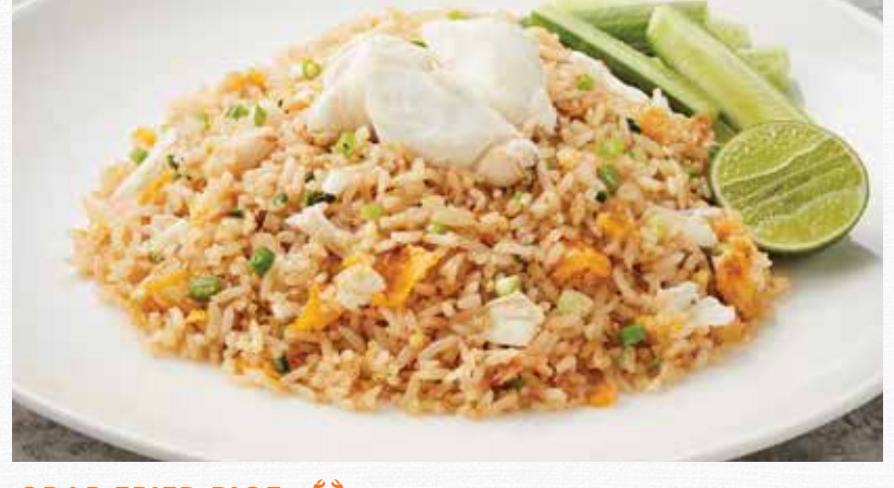
CRAB FRIED RICE (With Crab Meat, Egg and Shallot ข้าวผัดปู

ALL OUR DISHES MAY CONTAIN TRACES OF ALLEGENS