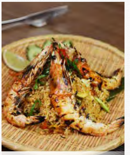
CHILLI BASIL FRIED RICE ข้าวผัดกระเพรา