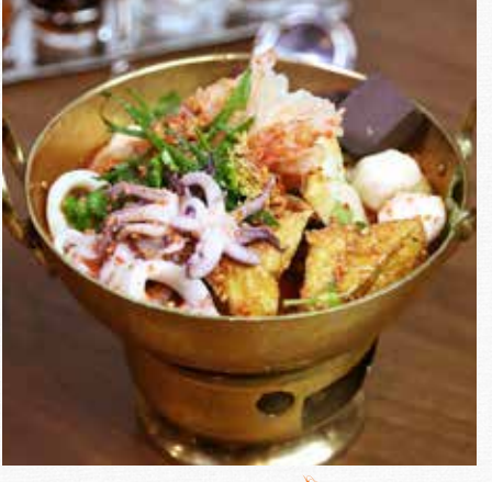
TOM YUM SOUP Spicy pink soy bean paste soup with fish ball, blood jelly and squid