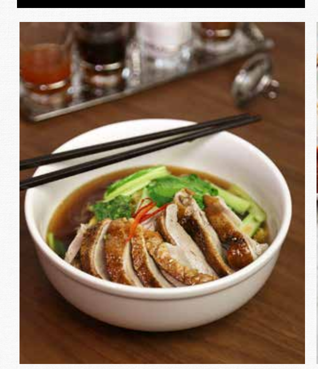
ROASTED DUCK NOODLE SOUP Egg Noodle in Five Spices Soup with Asian Green