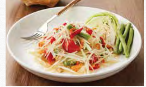
Papaya Salad with Dried Shrimp and Peanut สัมตำไทย 19.9