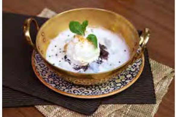
THAI GNOCCHI IN COCONUT CREAM